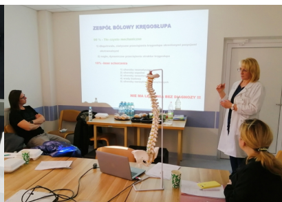
Kursy w ramach Programu Specjalizacji z Rehabilitacji Medycznej