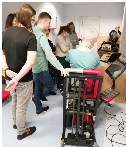
Program Specjalizacji z Rehabilitacji Medycznej